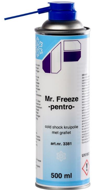
500ml - art.nr. 3381