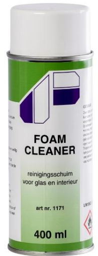
400ml - art.nr. 1171

Indien geen zekerheid bestaat over bestendigheid van het te reinigen oppervlak, altijd eerst op een onopvallende plaats testen.