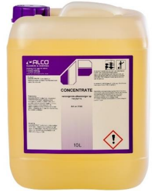
10L - art.nr. 1143