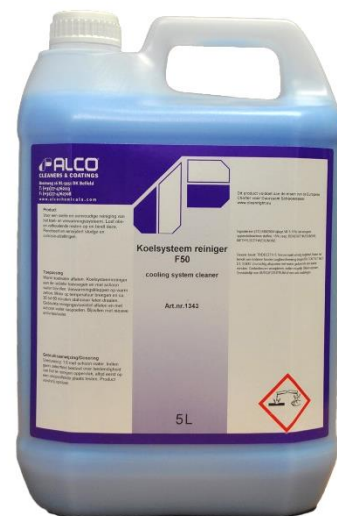
5L - art.nr. 1343

Voor een snelle en eenvoudige reiniging van het koel- en verwarmingssysteem. Lost olie- en vethoudende resten op en bindt deze. Penetreert en verwijdert sludge en corrosie-afzettingen.