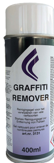
400ml - art.nr. 3131

GRAFFITI REMOVER kan toegepast worden voor allerlei verfsoorten. Wij adviseren vóór het reinigen eerst een proef te doen op een onopvallende plaats. Dit in verband met het hoge oplossingsvermogen van GRAFFITI REMOVER.