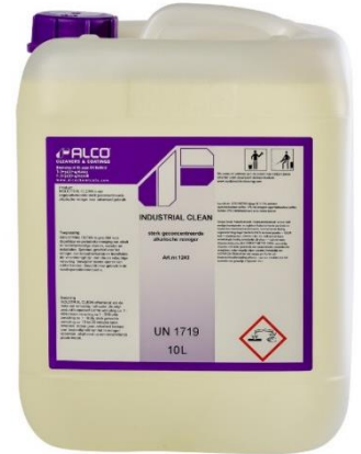
10L - art.nr. 1243

ALCO MAX -13 is geschikt voor dagelijkse en periodieke reiniging van alkali- en waterbestendige vloeren, wanden en installaties. Past in een HACCP hygiëneplan mits toegepast volgens de regels HACCP Horeca 2016. Speciaal geschikt voor het reinigen van industrievloeren en installaties die verontreinigd zijn met olie- en vetachtige vervuiling. Verwijdert tevens sporen van rubberbanden. ALCO MAX -13 is geschikt voor het reinigen van: