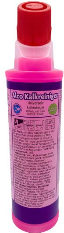
750ml art.nr. 1391