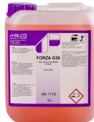
5L - art.nr. 1202

Wij adviseren vóór het reinigen eerst een proef te doen op een onopvallende plaats. FORZA -G30- is niet geschikt op aluminium.