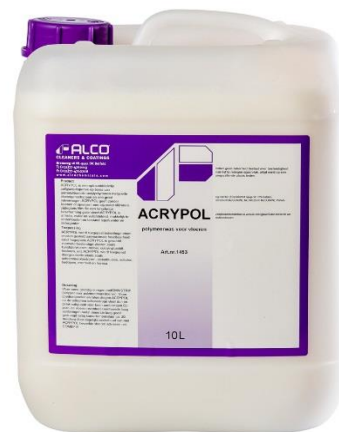
10L - art.nr. 1453

ACRYPOL wordt toegepast indien hoge eisen worden gesteld aan maximale houdbaarheid en/of hoge glans. ACRYPOL is geschikt voor epoxy coating vloeren.