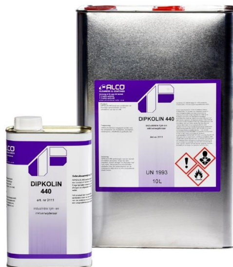
1L – art.nr. 3111 / 10L - art. nr. 3113

DIPKOLIN 440 puur aanbrengen met borstel of door middel van dompelen. Enige tijd laten inwerken, daarna afvegen en afspoelen met ruim water. Het product kan kunststoffen aantasten. Voor de bestendigheid van de ondergrond altijd eerst op een onopvallende plaats testen.